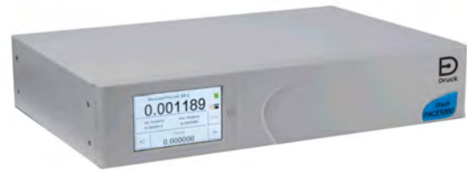
PACE5000 Modularer Hochpräzisions-Druckregler zur pneumatischen Messung und Regelung von Drücken