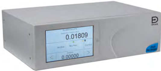
PACE6000 Modularer Hochpräzisions-Druckregler zur pneumatischen Messung und Regelung von Drücken