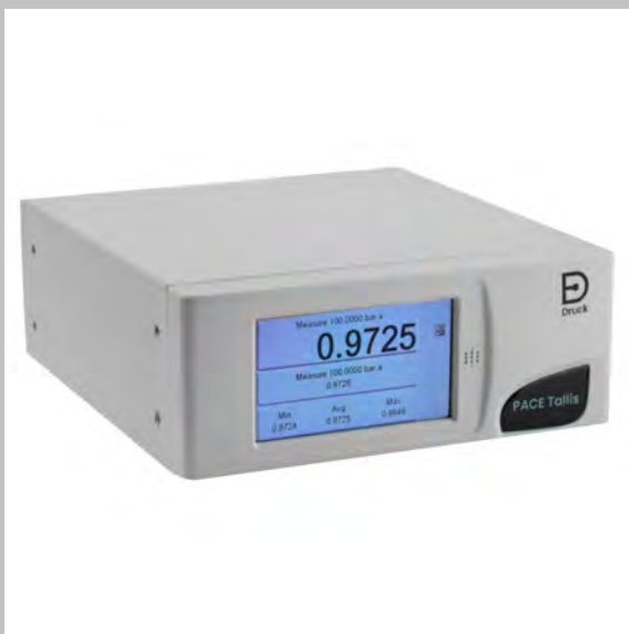
PACE Tallis Hochpräzisionsdruckmessgerät (10 ppm FS)

Der neue modulare pneumatische Druckregler PACE vereint die neueste Steuerungs- und Messtechnik von Druck zu einer eleganten, schnellen, flexiblen und wirtschaftlichen Lösung für die Druckregelung in der automatisierten Produktion, Prüfung und Kalibrierung. PACE verwendet eine vollständig digitale Steuerung, um eine hohe Regelungsstabilität und eine hohe Regelgeschwindigkeit zu gewährleisten, während der digital charakterisierte Drucksensor die Qualität, Stabilität, höhere Bandbreite und Präzision bietet, die mit dieser neuesten Generation von piezoresistiven und TERPS-Geräten verbunden sind.