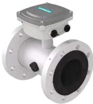
SITRANS FMS500 Sensor