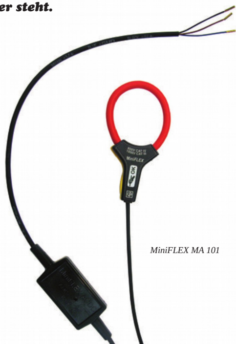
MiniFLEX MA 101