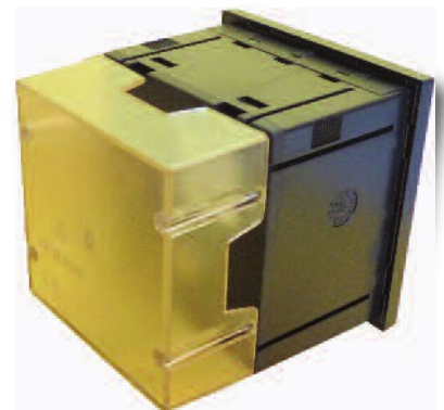
RQ72FI - RQ96FI Coprimeretto di serie Standard terminal cover