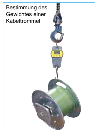
Bestimmung des Gewichtes einer Kabeltrommel